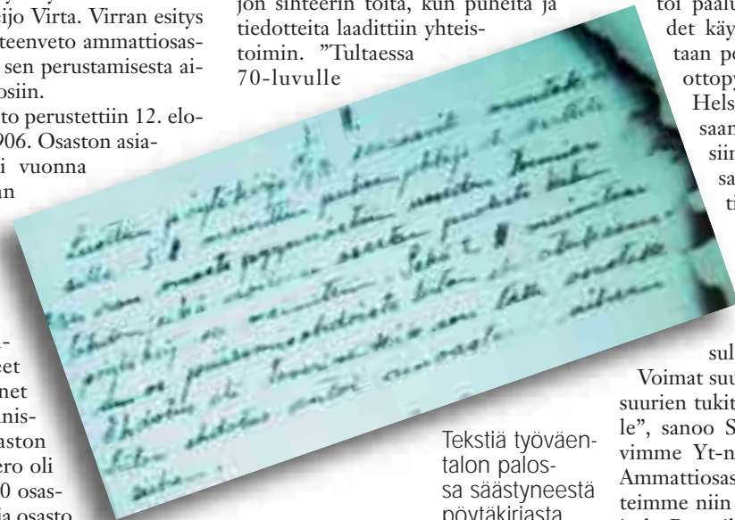
Tekstiä työväentalon palossa säästyneestä pöytäkirjasta.

Voikkaan ammattiosaston historian teos ilmestyy helmikuussa. Se sisältää ennen julkaisematonta tietoa Voikkaan tehtaan ja ammattiosaston viimeisistä vaiheista. "Voikkaan henki" elää yhä.