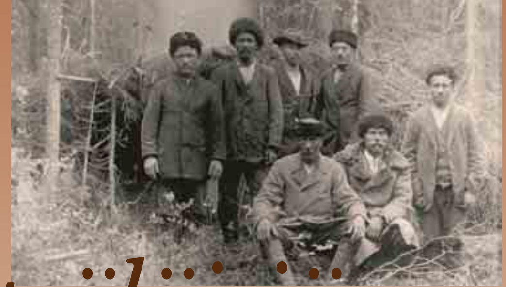
Tobmajärveläisiä punaisia valkoisia paossa 1918.